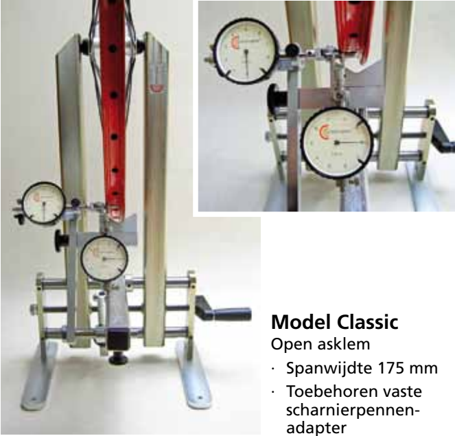
Model Classic Open asklem · Spanwijdte 175 mm · Toebehoren vaste scharnierpennen-adapter