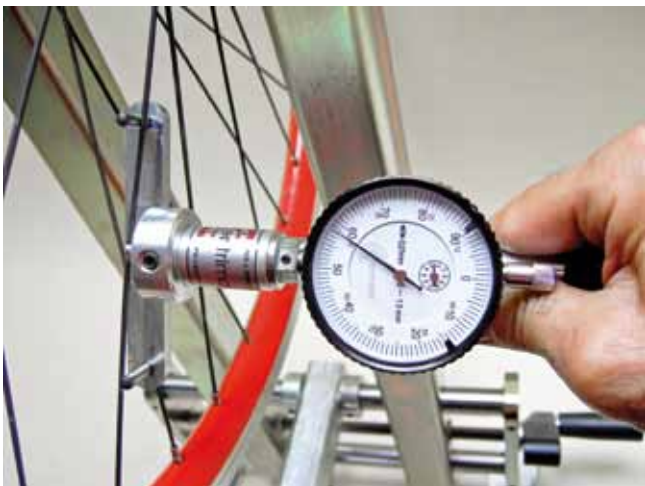
Tensiometer met kalibreerlijst, ook voor bladspaken