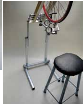
Model vloerrek met helling ▶