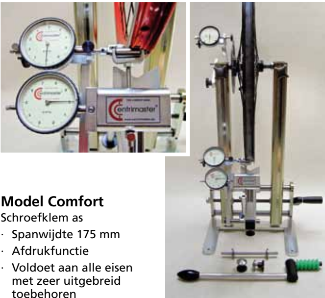
Model Comfort Schroefklem as · Spanwijdte 175 mm · Afdrukfunctie · Voldoet aan alle eisen met zeer uitgebreid toebehoren

NB! Alle basisframes zijn met de meetmiddelen compatibel (Type Genius is een zelfstandig systeem)