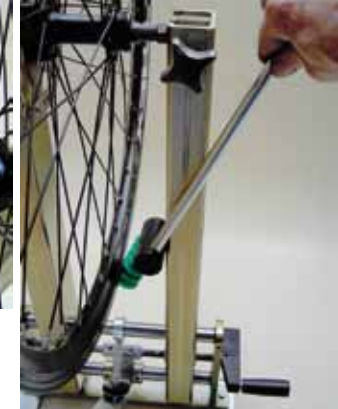
Afdrukfunctie alleen model Comfort