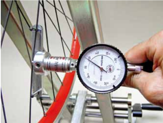
Tensiometer met kalibreerlijst, ook voor bladspaken