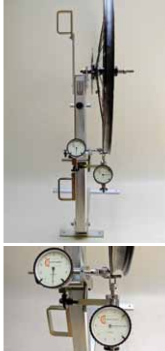
Model Genius · meetklokken voor zijde en hoogte · geïntegreerde tussenmal · meten en centreren ook met dekking · opvouwbaar · meet ook remschijven · met vaste scharnierpennenadapter

NB! Alle basisframes zijn met de meetmiddelen compatibel (Type Genius is een zelfstandig systeem)