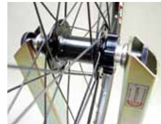
Bevestigingspunten voor vaste scharnieren universeel tot d 28mm