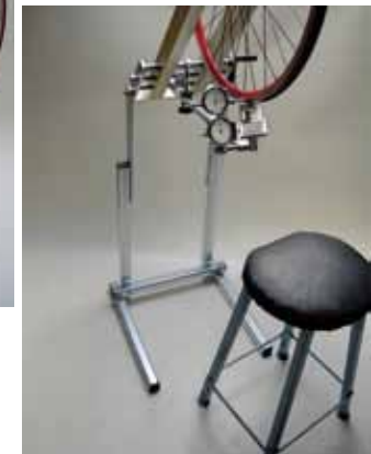
Model vloerrek met helling ▶