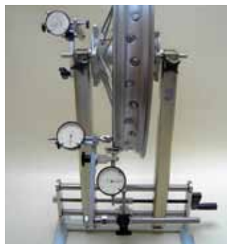
Model Motorfiets Schroefbare asklem · Spanwijdte 300 mm · met adapter voor bevestigingspunten wiel · Toebehoren remschijvenmeter · ook geschikt voor fietsen