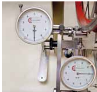
Grote Meetklokken d 80mm voor model Comfort en Classic