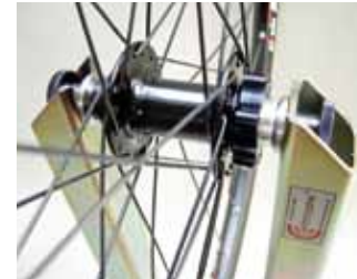
Bevestigingspunten voor vaste scharnieren universeel tot d 28mm