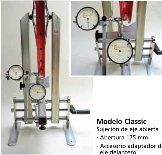
Modelo Classic Sujeción de eje abierta · Abertura 175 mm · Accesorio adaptador de eje delantero