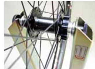
Soporte para ejes delanteros universales hasta D 28mm