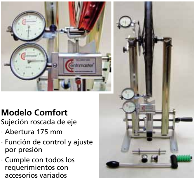
Modelo Comfort Sujeción roscada de eje · Abertura 175 mm · Función de control y ajuste por presión · Cumple con todos los requerimientos con accesorios variados

¡Atención! Todos los marcos son compatibles con los dispositivos de calibración (El tipo Genius es un sistema propio)