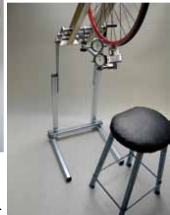
◀ Soporte de mesa Dispositivo inclinable