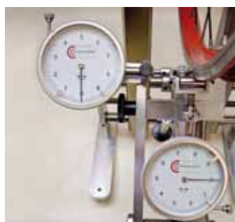
Grand calibre à cadran D 80 mm pour les modèles Comfort et Classic