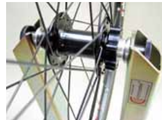
Logement universel pour demi-arbres jusqu'à D 28 mm