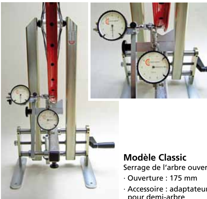
Modèle Classic Serrage de l'arbre ouvert · Ouverture : 175 mm · Accessoire : adaptateur pour demi-arbre