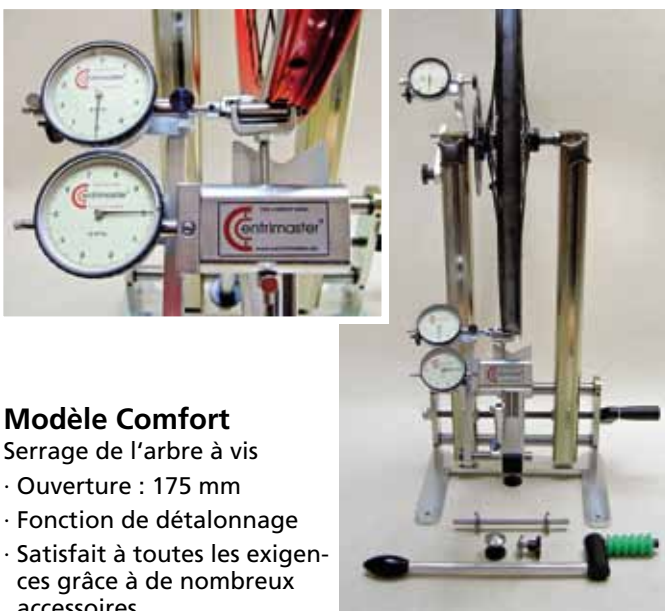
Modèle Comfort Serrage de l'arbre à vis · Ouverture : 175 mm · Fonction de détalonnage · Satisfait à toutes les exigences grâce à de nombreux accessoires

Attention ! Tous les châssis de base sont compatibles avec les dispositifs de mesure (le modèle Genius est un système indépendant)