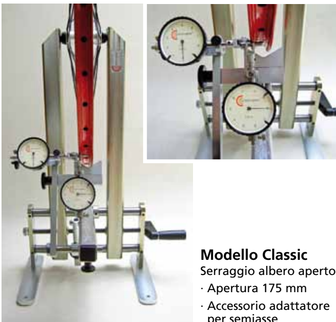
Modello Classic Serraggio albero aperto · Apertura 175 mm · Accessorio adattatore per semi-asse