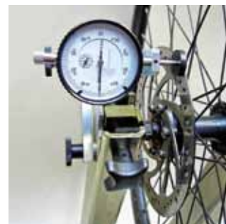
Dispositivo di misurazione dischi dei freni solo Modello Comfort