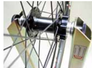
Adattatore per semi-asse universale Fino a D 28mm