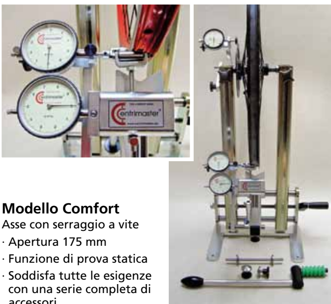
Modello Comfort Asse con serraggio a vite · Apertura 175 mm · Funzione di prova statica · Soddisfa tutte le esigenze con una serie completa di accessori

Attenzione! Tutti i telai di base sono compatibili con i dispositivi di misurazione (Il tipo Genius è un sistema indipendente)