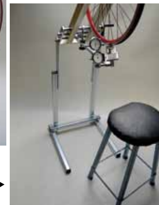
Supporto da pavimento Dispositivo di inclinazione