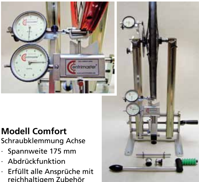
Modell Comfort Schraubklemmung Achse · Spannweite 175 mm · Abdrückfunktion · Erfüllt alle Ansprüche mit reichhaltigem Zubehör

Achtung! Alle Grundrahmen sind mit den Messeinrichtungen kompatibel (Typ Genius ist ein eigenständiges System)