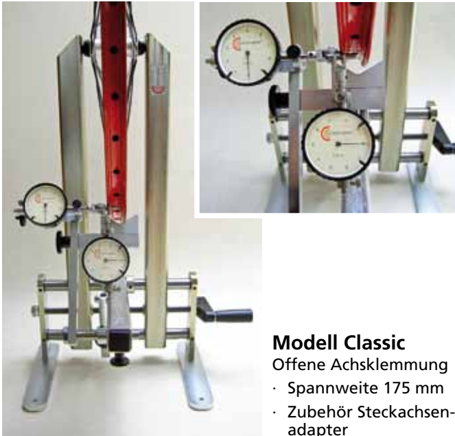
Modell Classic Offene Achsklemmung · Spannweite 175 mm · Zubehör Steckachsenadapter