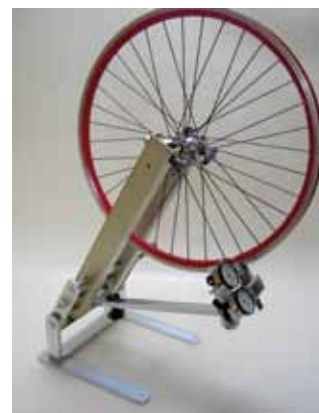
Supporto da pavimento Dispositivo di inclinazione